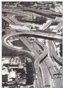
CLAVE.— El proyecto que envía al MOP al Congreso decidirá el futuro de las concesiones.