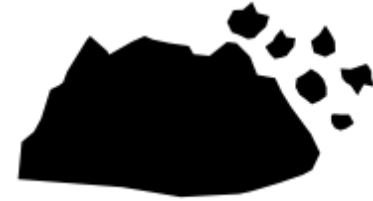
Excedentes- tierra de la construcción